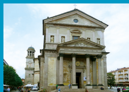
Collegiata S. Vittore - Verbania Intra