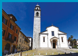
Collegiata S. Leonardo - Verbania Pallanza