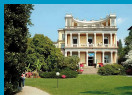
Villa Giulia - Verbania Pallanza