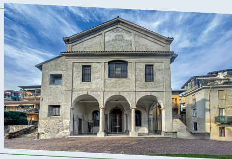
Chiesa di Santa Marta Verbania Intra