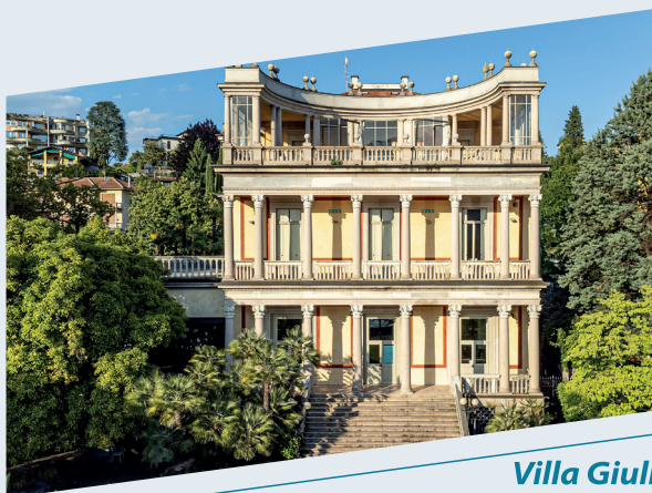
Villa Giulia Verbania Pallanza