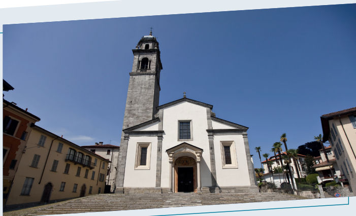
Collegiata S. Leonardo Verbania Pallanza